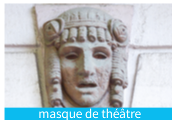
masque de théâtre