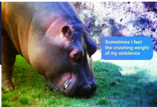
Basim Magdy, Production en cours, 2019 ©Basim Magdy

Attiré par les sciences, l'inexplicable, l'impressionnant, Basim Magdy reconnaît par ailleurs un attrait pour la beauté des mots, la musicalité d'un son ou l'harmonie d'une gamme colorée. Que ce soit en peinture, en photographie ou en images filmées, Basim Magdy compose à partir de prélèvements du monde qu'il observe. Il extrait des images, il les façonne, les détourne comme un scientifique tente des expériences à partir du réel pour obtenir une réalité secondaire. Il obtient alors une nouvelle matière avec laquelle il questionne l'existentiel ou raconte une histoire plus personnelle.