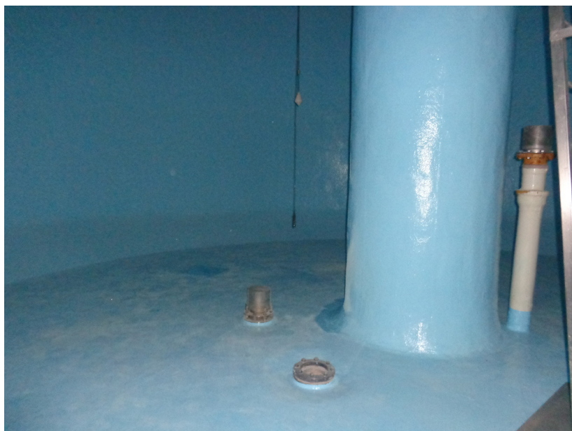
Cuve du château d'eau