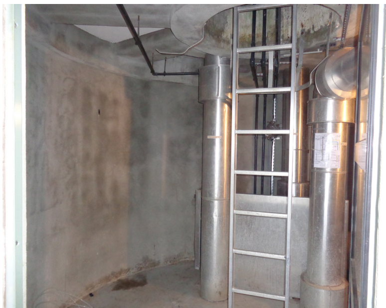
Sas d'entrée dans la cuve